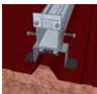
2 Fixation du rail