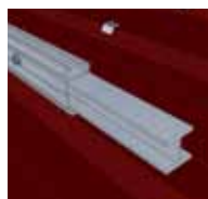
3 Fixation de l'éclisse de raccord