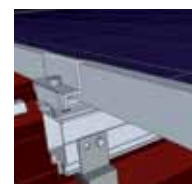
5 Fixation des clamps simples, pose des modules