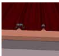
1 Fixation des cavaliers