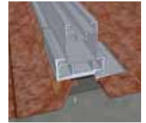
2 Emboîtement du rail