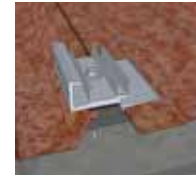
1 Fixation des platines d'ancrage