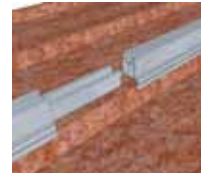
4 Raccordement du rail suivant avec l'éclisse