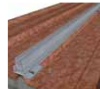
3 Fixation du rail