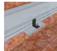
5 Pose de la calle de bloquage