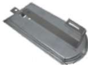
Pour tuile plate : Crochet queue de Castor +Plaque de substitution