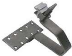
Pour tuile canal : Crochet 45 Rapid2+