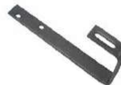
Pour l'ardoise : Crochet Ardoise